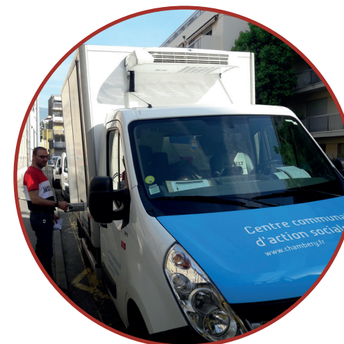
La livraison des repas