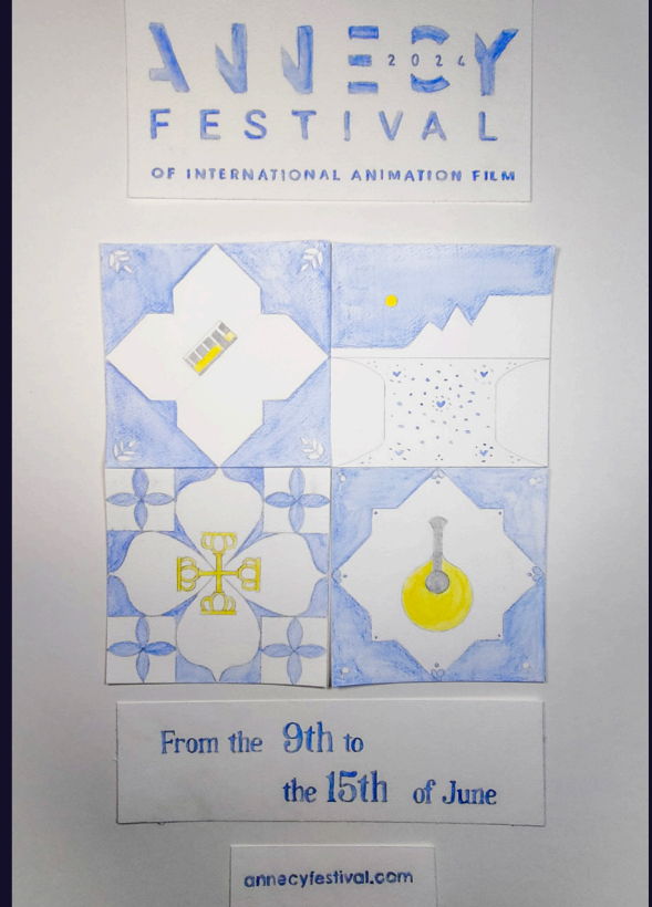
Teaser pour le Festival d'Annecy Croquis, animation en stop motion, aquarelle, 2024