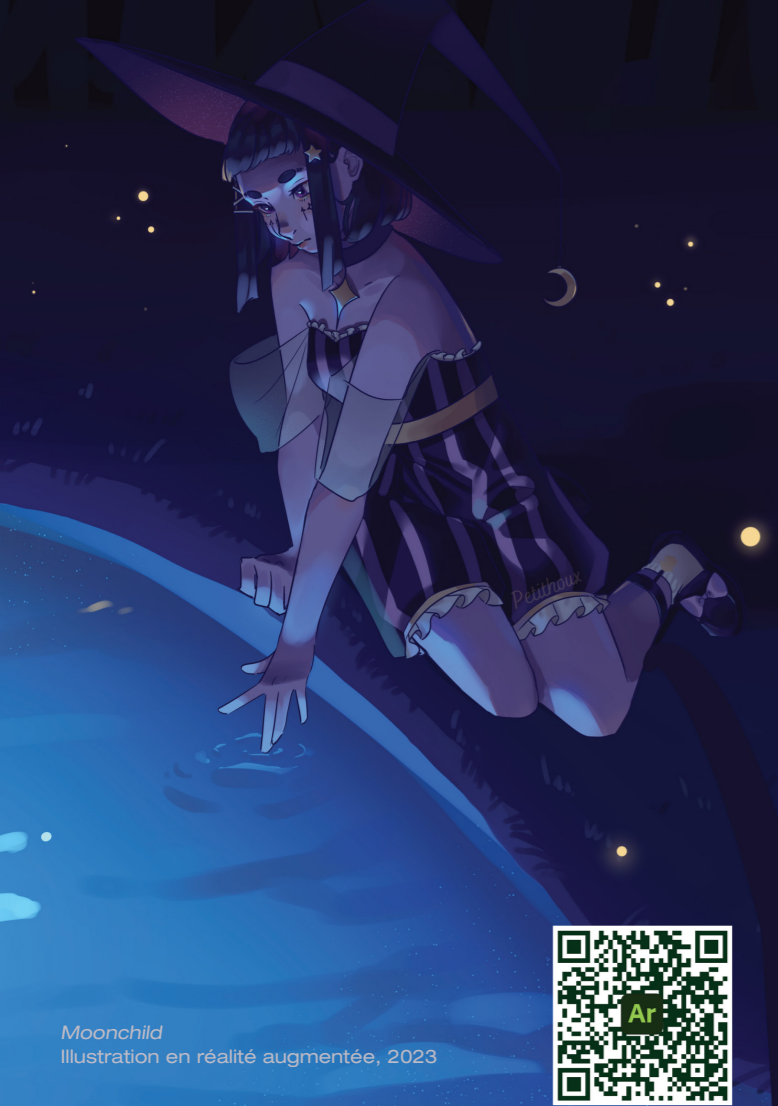
Moonchild Illustration en réalité augmentée, 2023