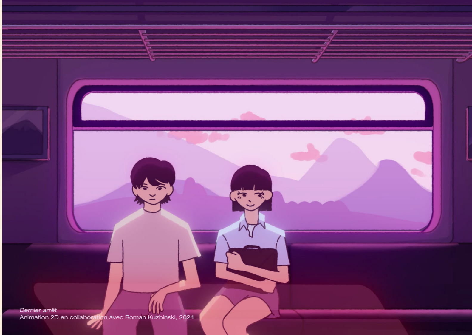
Dernier arrêt Animation 2D en collaboration avec Roman Kuzbinski, 2024