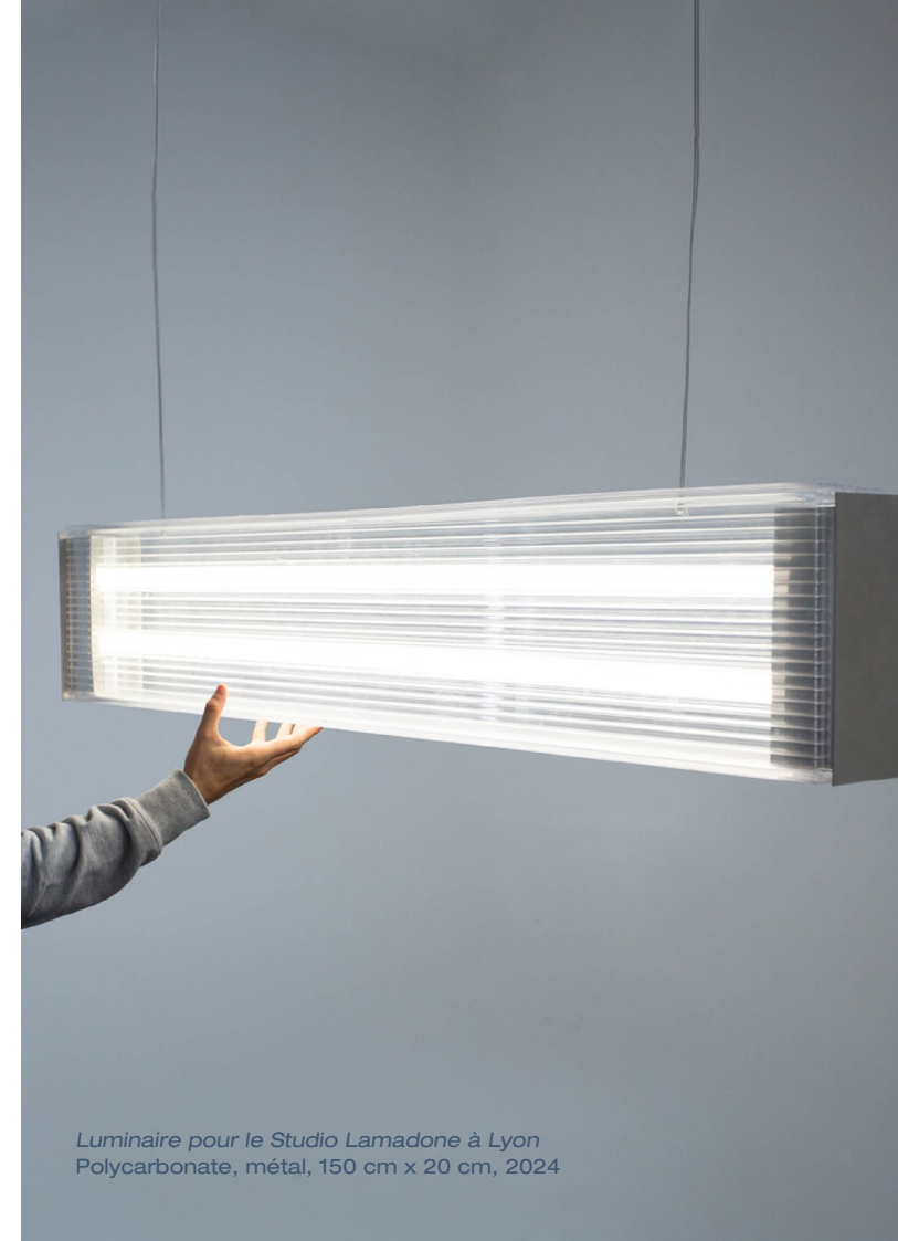
Luminaire pour le Studio Lamadone à Lyon Polycarbonate, métal, 150 cm x 20 cm, 2024