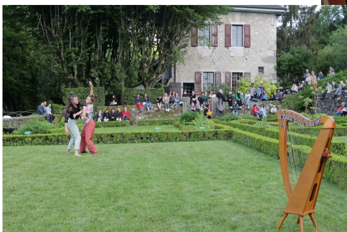
Nuit européenne des musées, spectacle de danse dans les jardins des Charmettes, mai 2024.