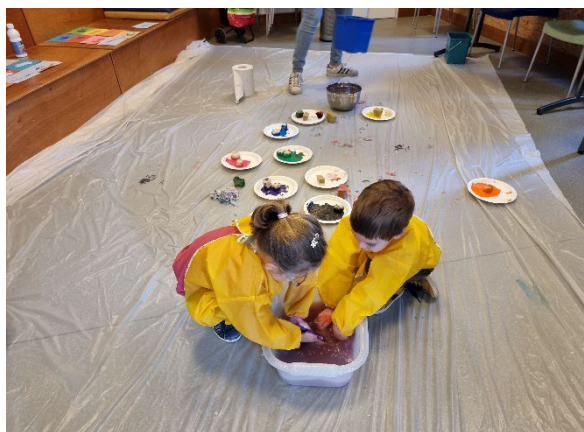
Atelier bricolibre et peinture à la bibliothèque G. Brassens, dans le cadre du festival Saperlipopette, mars 2022.

Pour permettre une continuité dans le parcours de l'enfant, des actions sont également expérimentées sur les temps périscolaires depuis la rentrée 2024 et d'autres se poursuivent avec les structures d'accueil de loisirs de la ville.