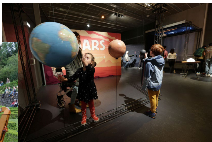
Exposition « En avant Mars », à la Galerie Eurêka, en cours jusqu'au 29 mars.