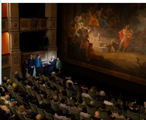
Bicentenaire du théâtre Charles Dullin, en septembre 2024, avec des animations gratuites pour toutes et tous.