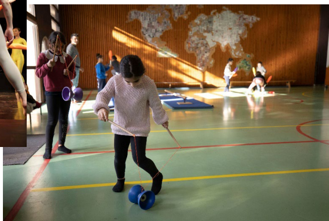
Atelier de cirque dans le cadre du projet Kézaco, à l'école du Mollard, février 2023.