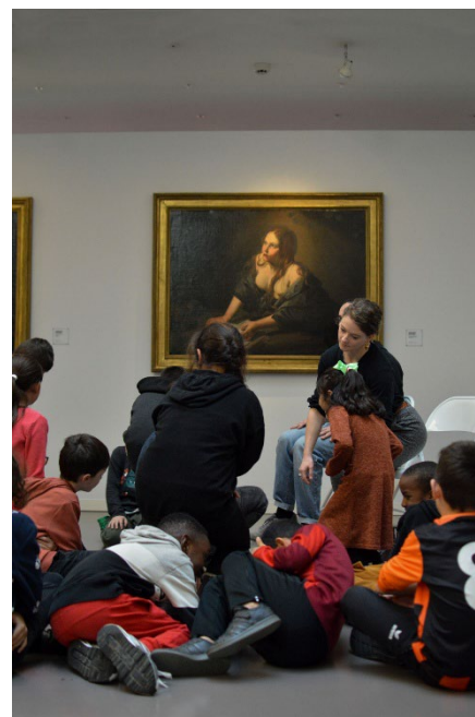
Projet Kézaco à l'école Chantemerle, visite dansée au musée des Beaux-Arts dans le cadre du projet « Corps à l'œuvre », février 2023.

Pour le public scolaire (de la maternelle au lycée), la grande richesse de l'offre culturelle chambérienne se structure depuis la rentrée 2021, à la faveur d'un partenariat fort avec la Direction des services départementaux de l'Education nationale. Depuis 2023, elle se développe en deux niveaux : « découverte » et « immersion », permettant à chaque élève scolarisé de bénéficier d'un parcours artistique et culturel cohérent et diversifié. L'offre « découverte » permet à l'élève de fréquenter les structures culturelles du territoire autour d'actions ponctuelles constituant un premier contact avec des œuvres. L'offre « immersion », dédiée aux écoles maternelles et élémentaires, associe toutes les classes d'une école à une structure culturelle pour l'année, pour un projet mêlant rencontre avec les œuvres, pratique artistique et appropriation culturelle.