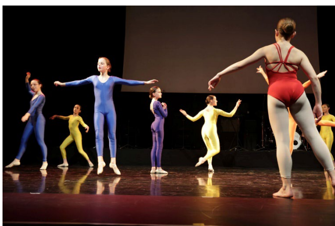
« Le Grand Voyage minuscule », spectacle proposé par la Nième Compagnie dans le cadre de la résidence de territoire, en avril 2024.